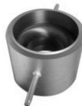
Сопло ИСА 1932