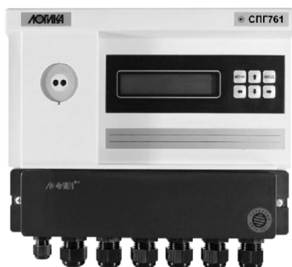
Рисунок 1 - Корректор СПГ761 (СПГ762)

Общий вид составных частей ИК приведен на рисунках 1 - 6.