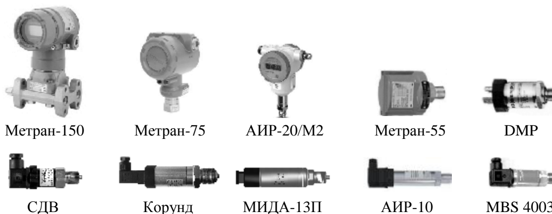
Рисунок 4 - Преобразователи давления. Общий вид