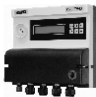
Рисунок 1 - Тепловычислитель СПТ943. Общий вид