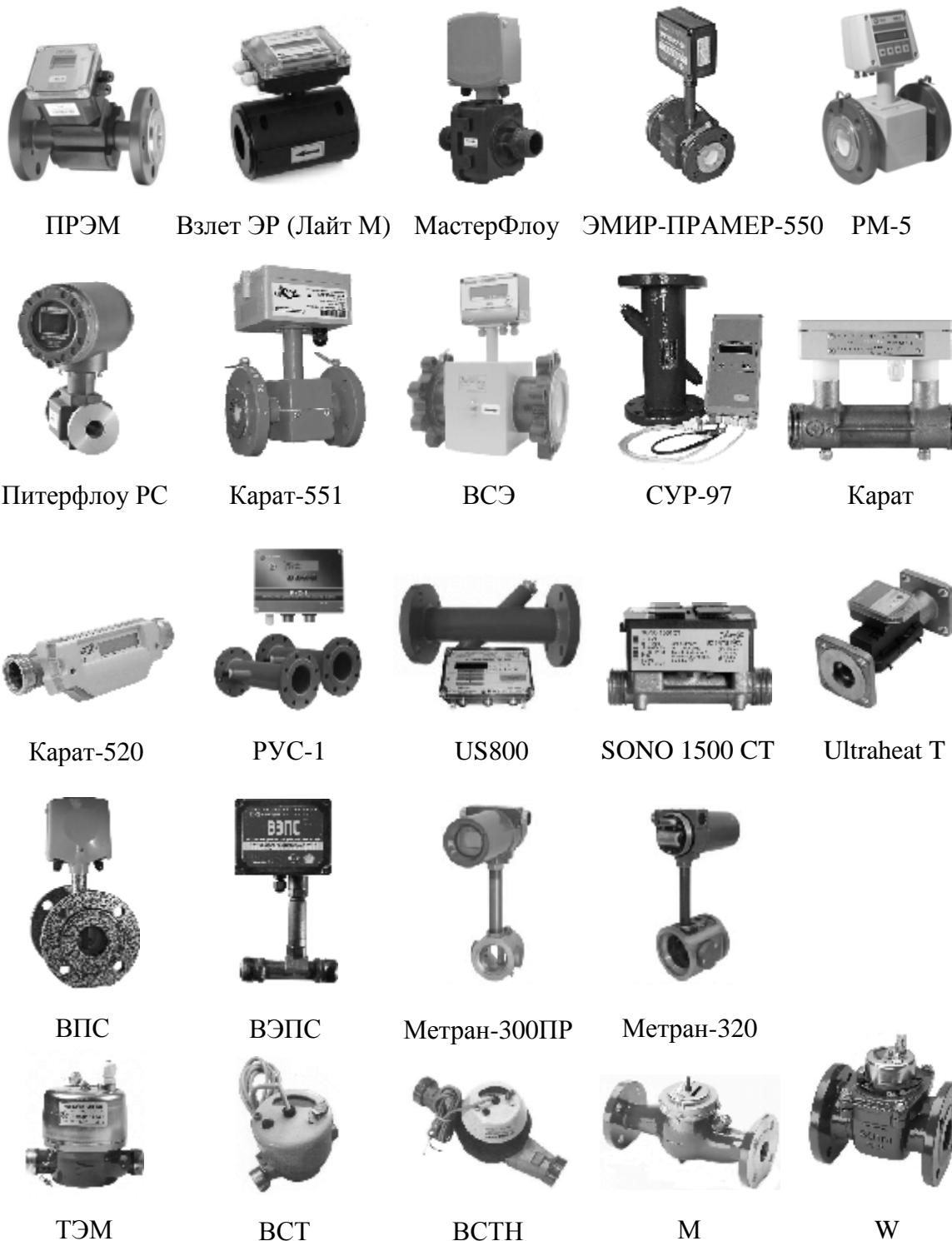
Рисунок 2 - Преобразователи расхода. Общий вид